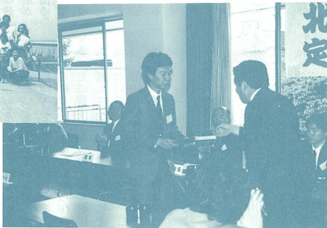
大学総会で表彰を受ける北釣会