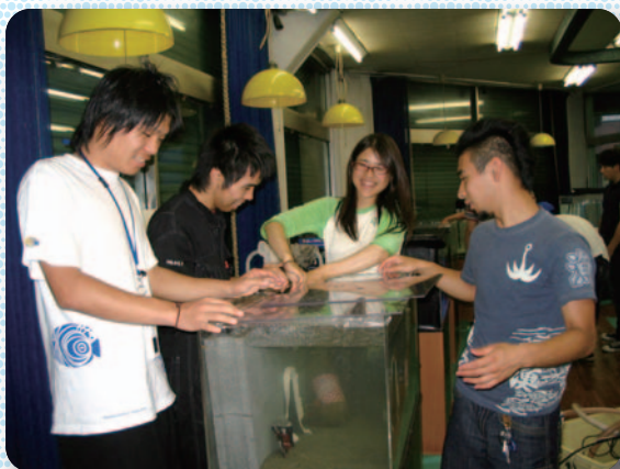
前日の奮闘水槽準備